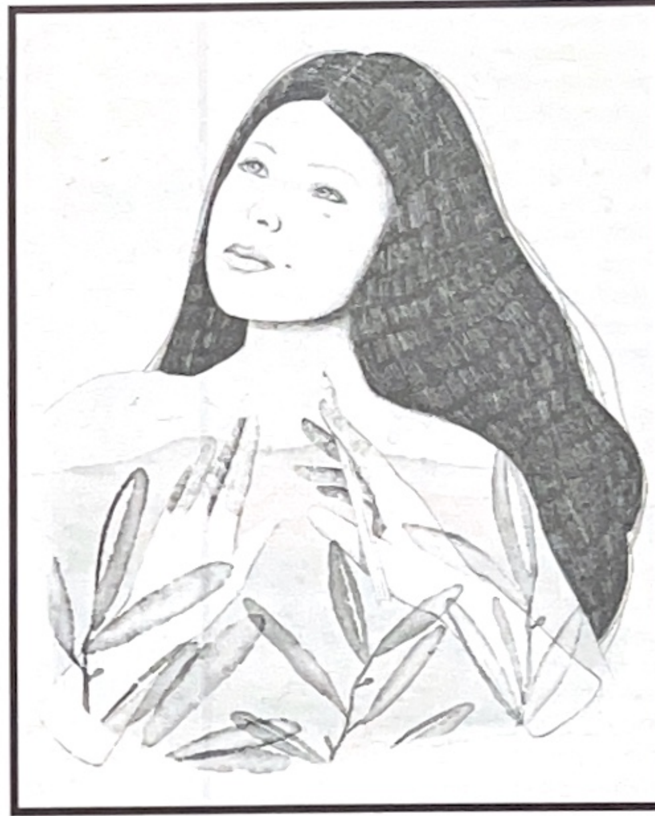
En la imagen superior izquierda, la ilustración 'Desayuno en Lanzarote'. A su derecha, la imagen del capítulo homenaje a Leonard Bernstein. Debajo, un retrato de la escritora Sanmao. A su izquierda, el paisaje del capítulo de Saramago.